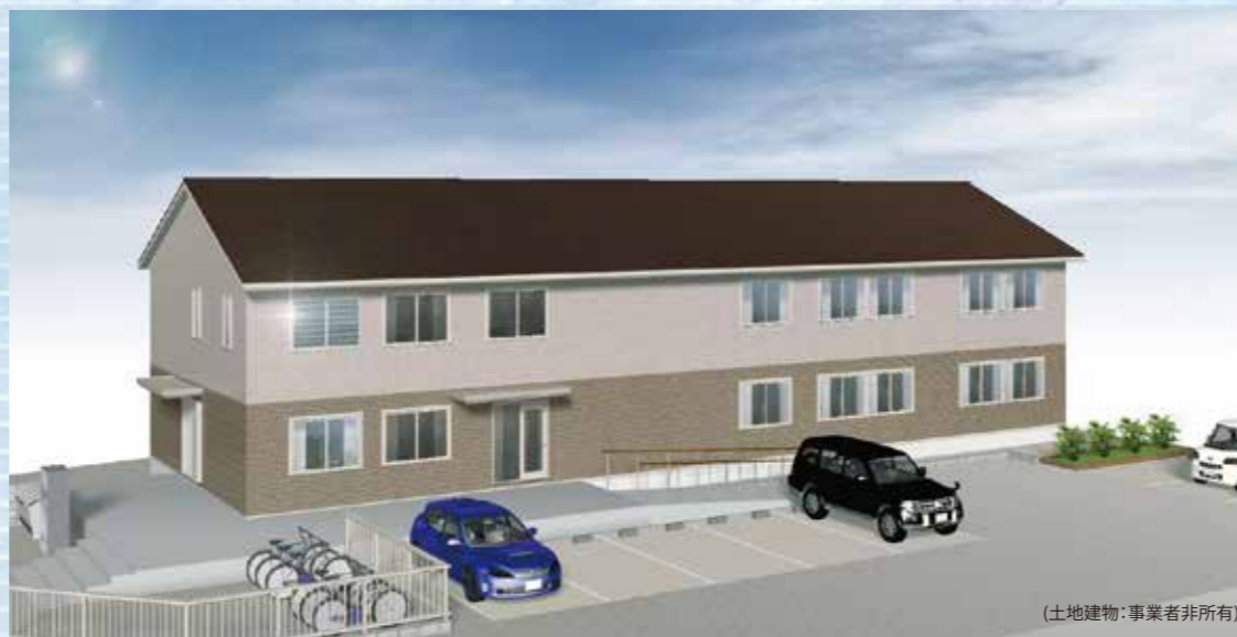
(土地建物:事業者非所有)