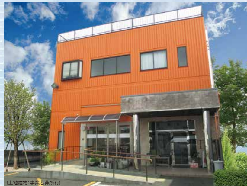
(土地建物：事業者非所有)