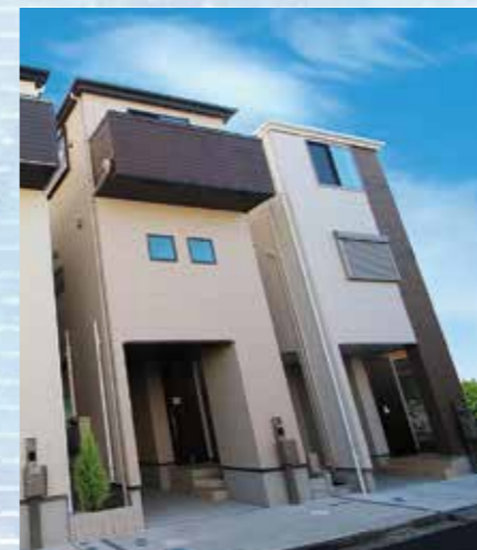
ユニット 竹の塚A・B (土地・建物：事業者非所有)